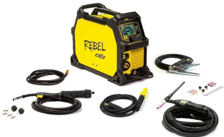
Rebel EMP 205ic AC/DC i akcesoria

Urzeczywistniliśmy marzenia, wprowadzając na rynek pierwsze przenośne, wszechprocesowe urządzenie z funkcjami spawania MIG, drutem rdzeniowym, MMA, DC TIG, a także AC TIG, co oznacza — tak! — że nadaje się nawet do spawania TIG aluminium. To pierwszy na rynku NAPRAWDĘ wielofunkcyjny system spawania do wszystkich procesów w trwałej, wygodnej w przenoszeniu obudowie klasy przemysłowej, który jest w stanie spawać wszystko i wszędzie.